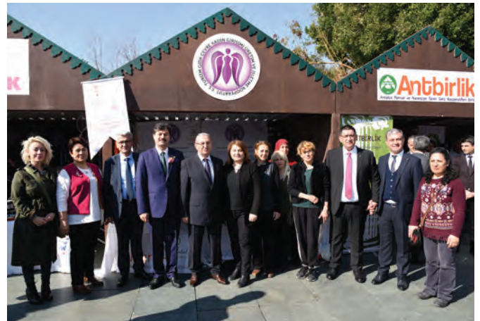
Kooperatifçilik Otobüsü Antalya'da