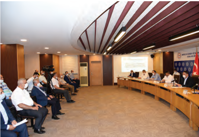
Toplu ulaşım esnafı destek bekliyor