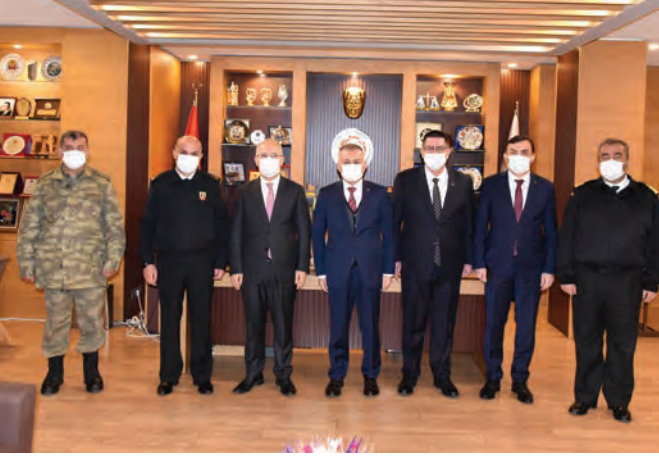
Vali, Başsavcı, Emniyet Müdürü ve Komutanlarımızı ağırladık