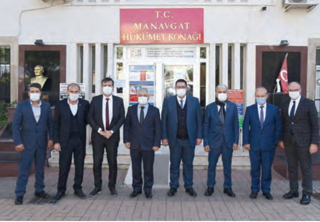
Manavgat Kaymakamımız ile esnaf ve sanatkarımızı konuştuk