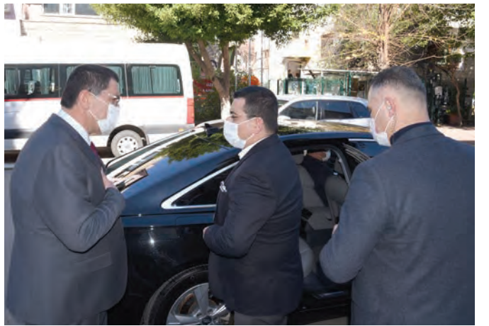
Kepez Belediyesi'nden esnafa destek