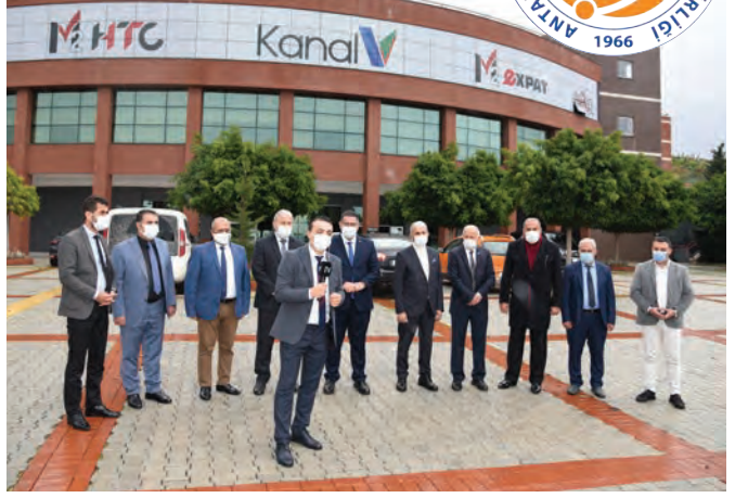
Kanal V Alanya Şubesi'ne Başkanlarımızla ziyaret