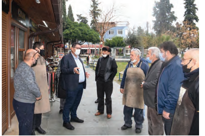
Ayakkabıcılar Çarşısı'nda esnafımızı ziyaret ettik